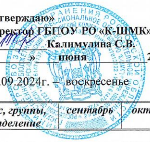
ГРАФИК учебного процесса ГБПОУ РО «Каменск-Шахтинский медицинский колледж»