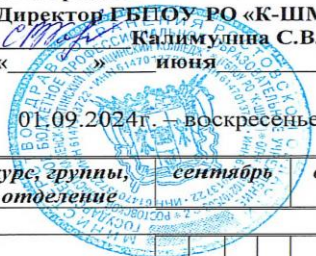
ГРАФИК учебного процесса ГБПОУ РО «Каменск-Шахтинский медицинский колледж»